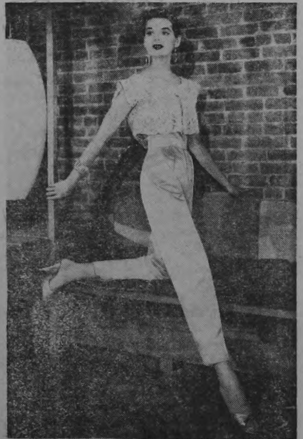
FASHION LEAGUE - 7-17-55 - A

He aquí un traje para el hogar, tan atractivo como elegante, los pantalones, que llegan hasta algo más arriba de los tobillos, se van estrechando hacia abajo; arriba terminan en un borde ancho imitando un cinturón. Un bolero de encaje, sin mangas, completa este conjunto tan agradable y cómodo.