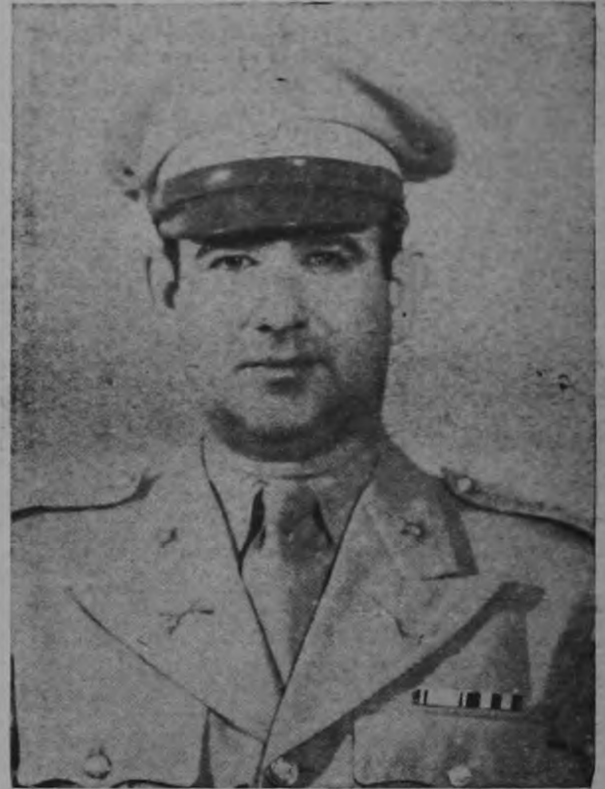
TENIENTE CORONEL DON JOSE MARIA LEMUS